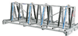
Cx - 4 CX 4 B