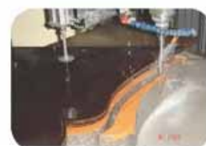
Détourage de stèles funéraires

"Vous réaliserez avec facilité les travaux les plus variés"