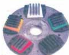
Polissage à plat